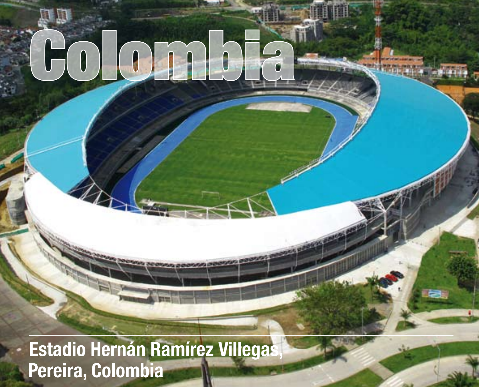
Estadio Hernán Ramírez Villegas, Pereira, Colombia